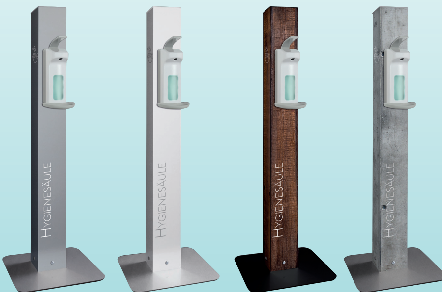
Art. Nr. 10069

Unsere Standardssäulen sind ab Lager erhältlich.